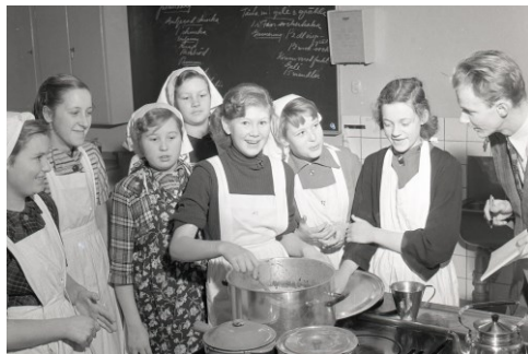
Julmat på meny för ungdomarna i skolköket, 1950-tal.

I sommar är det återigen dags för Sörmlands museums utomhusutställning "Bilder som berättar" runt om i länet. Arkiv Sörmland medverkar i fotoutställningen i Eskilstuna. Årets tema är "Ung i Sörmland". Håll utkik!