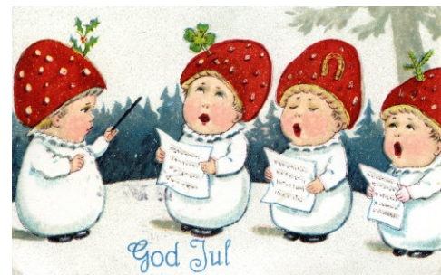
Julkort 1926. Celsingska familjearkivet, Arkiv Sörmland